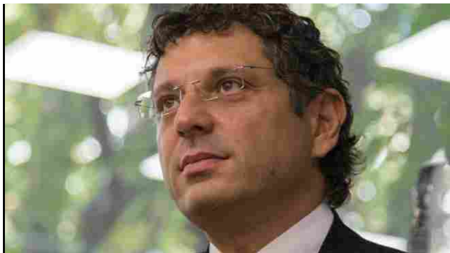
Il mandato del rettore Francesco Ubertini scadrà il 31 ottobre prossimo; elezioni a giugno

Bologna, 11 marzo 2021 - Manca poco: l'elezione del nuovo rettore dell'Università di Bologna sarà tra pochi mesi. Il mandato di Francesco Ubertini scadrà il prossimo 31 ottobre, ma è atteso per il 30 aprile il bando – indetto dal decano, ovvero il professore ordinario con più anzianità di ruolo dell'ateneo, in questo caso il geofisico Francesco Mulargia – in cui si delinearanno le linee guida per l'elezione e soprattutto si fisserà la data per le urne , che indicativamente sarà nella seconda metà di giugno, presumibilmente il 22-23 per il primo turno e il 29-30 per l'eventuale